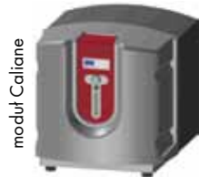
moduł Caliane wys.: 70 cm, szer.: 67 cm, głęb.: 74 cm