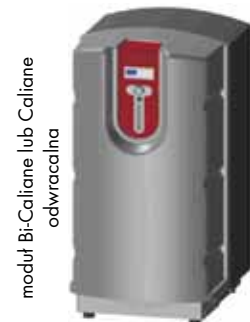
moduł Bi-Caliane lub Caliane odwracalna wys.: 130 cm, szer.: 67 cm, głęb.: 74 cm