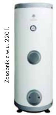
Zasobnik c.w.u. 220 l. wys.: 140 cm, średn.: 65 cm waga: 85 kg