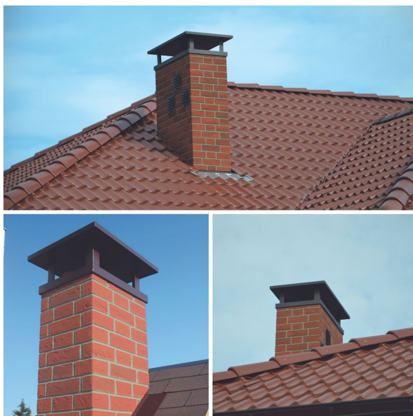
komin z blachy

Dedykowana jest dla inwestorów, którzy przede wszystkim cenią bezpieczeństwo, niezawodność, funkcjonalność, a w szczególności kładą nacisk na budowę nowoczesnych energooszczędnych domów.