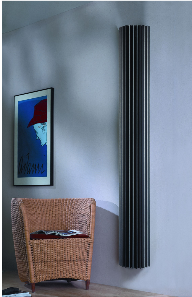
fot. JAGA Iguana

Kamienny grzejnik Geo, wykonany z drewna Knockonwood, kolorowy grzejnik Play, Crossroads w formie labiryntu, czy Atlantis o fakturze skamieliny - to tylko kilka przykładów przełomowych projektów Jaga. Pionierskich, nowatorskich, balansujących na granicy performance, ogrzewających nie tylko domy, ale i serca swoich użytkowników. Nie może być inaczej, jeśli grzejniki tworzy firma działająca w myśl zasady jej twórcy i właściciela, która brzmi: Innovate or die.