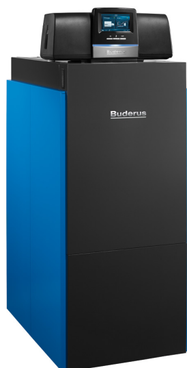
Gazowy kocioł kondensacyjny Logano plus KB372 ze sterownikiem Logamatic 5000